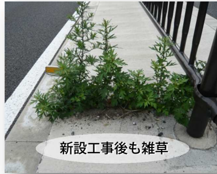
新設工事後も雑草