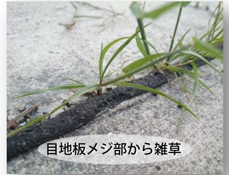
目地板メジ部から雑草