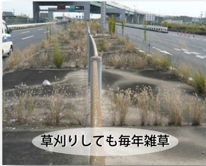
草刈りしても毎年雑草